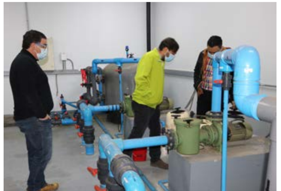
Sala de máquinas Piscina Temperada Municipal.