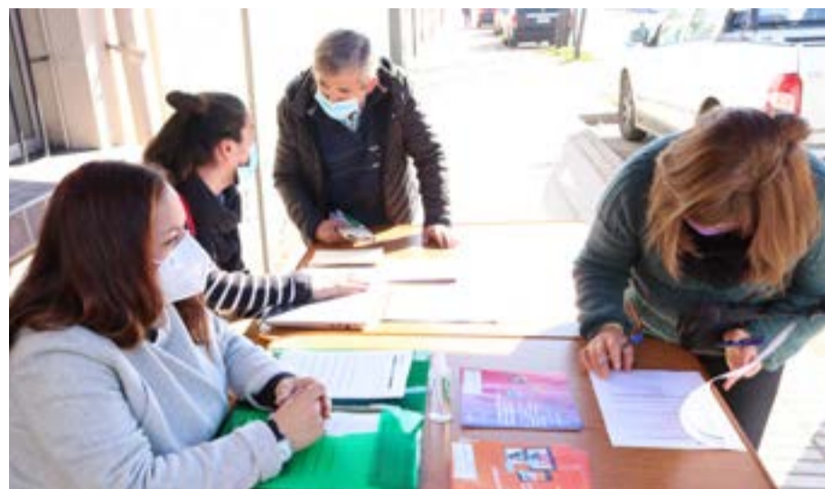
1 er Operativo del Gobierno Comunal en tu Barrio realizado en la JJ.VV El Carmen.

Para mayor información visita las redes sociales de la Municipalidad.