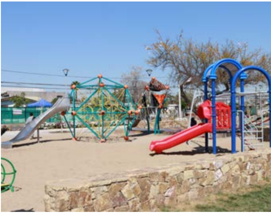
Nuevo sector de juegos en remodelada Plaza El Pinar.

y sentido de tránsito; 547 señales reglamentarias de vialidad; 30 señales de conectividad; 11 señales de equipamiento; 4.284 tachas reflectantes; 50 balizas cebra con panel solar y 7.233 m 2 de demarcación vial con pintura termoplástica en sectores de la comuna que presentan déficit.