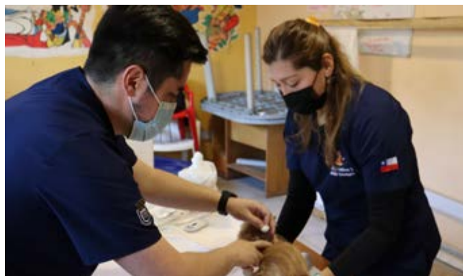
Operativo realizado en la JJ.VV. Germán Riesco.