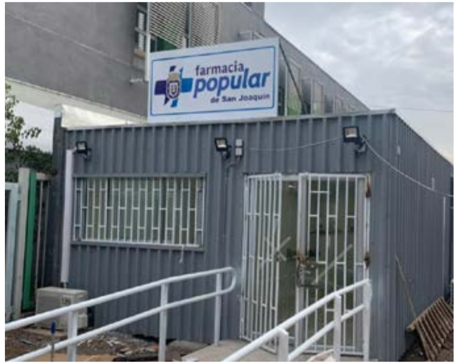
Obras Farmacia Popular Zona Sur ubicada en Pasaje Huara a un costado del CESFAM Santa Teresa.

Con un valor de $204.871.325, financiados por la Subsecretaría de Desarrollo Regional y Administrativo (SUBDERE), se realizó el mejoramiento del parque lumínico del sector comprendido en la Avda. Las Industrias, entre las calles Darwin por el Norte y Pureo