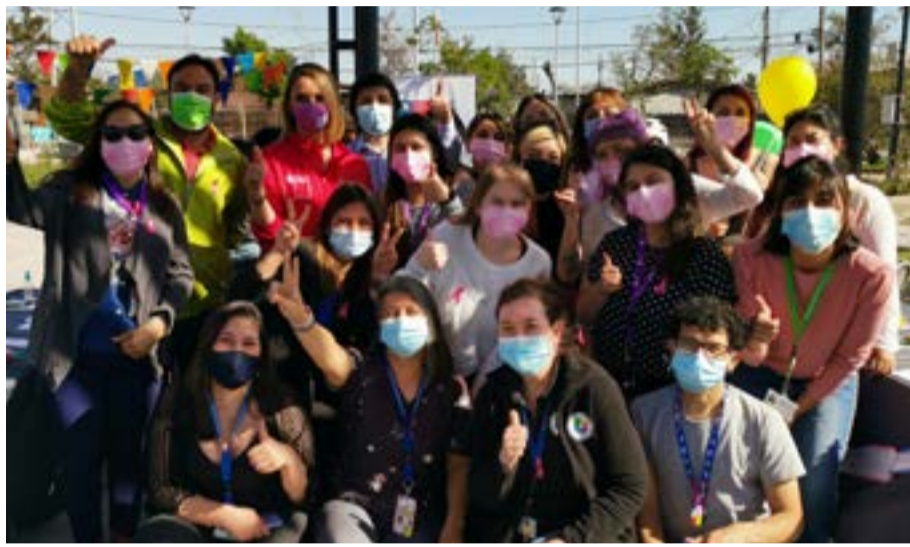
Feria de Prevención y Sensibilización realizada en Plaza El Pinar.

Las mujeres de la comuna se caracterizan por tener un rol activo y fundamental en el mundo del trabajo, los hogares y en la participación social. Es por eso, que es de gran importancia impulsar políticas comunales con perspectiva de género, con acceso a todas las mujeres sin discriminación de ningún tipo. La Oficina de la Mujer aborda temáticas de prevención de violencia de género, otorgándoles asesoramiento, orientación y en caso de ser necesario, realizar derivaciones a centros especializados.