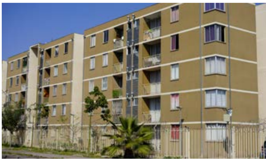
Pacífico Rivas III y IV.

Contar con viviendas de calidad para nuestros comités de allegados es una tarea primordial para la nueva administración municipal, es por eso que estamos trabajando para poder iniciar, el 2022 con la Entidad de Gestión Inmobiliaria Social (EGIS) Municipal, lo que permitirá que el proyecto sea gestionado en un 100% por el municipio, sin fines de lucro y de forma más ágil.