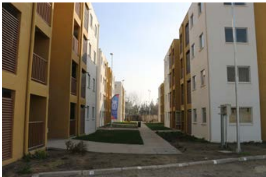
El Sueño de Todos.