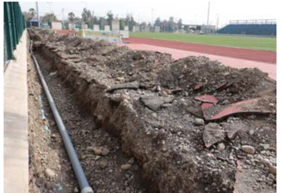
Costado pista atlética Estadio Municipal.