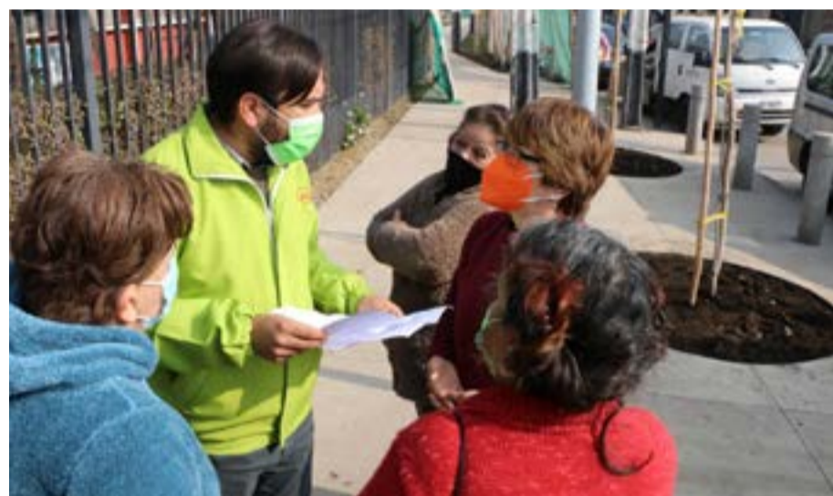
Operativo realizado en la JJ.VV. El Pinar.